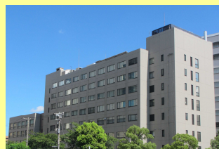
(千葉地方検察庁本庁舎)