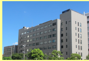
(千葉地方検察庁本庁舎)