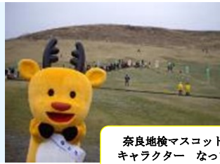
奈良地検マスコット キャラクター なっち